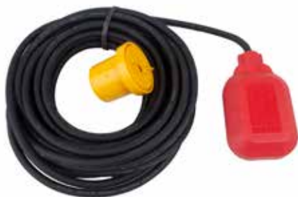
Niveau vippe med dobbelt kontakt