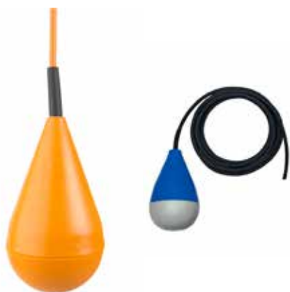
Kugle niveau vippe